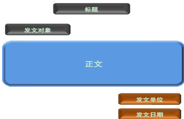
【图】公文通用格式范例